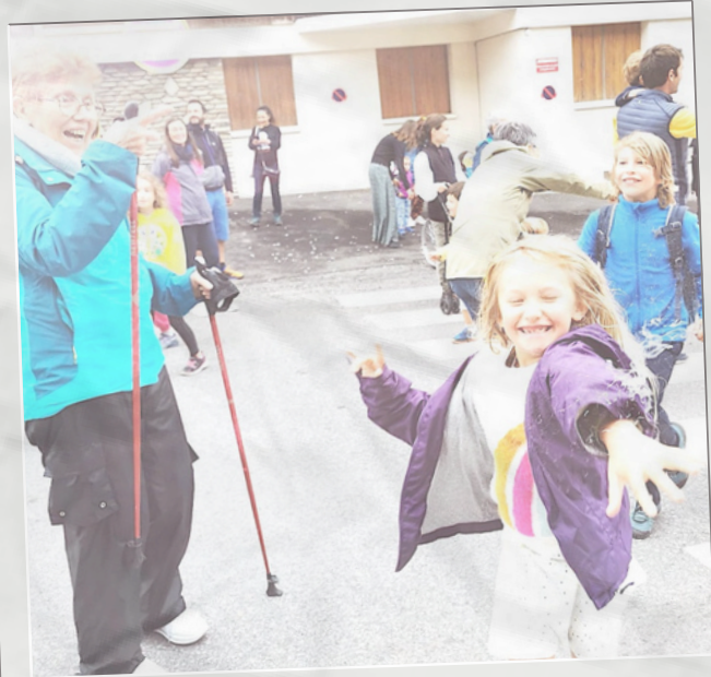
Au Bonheur des Mômes 2024