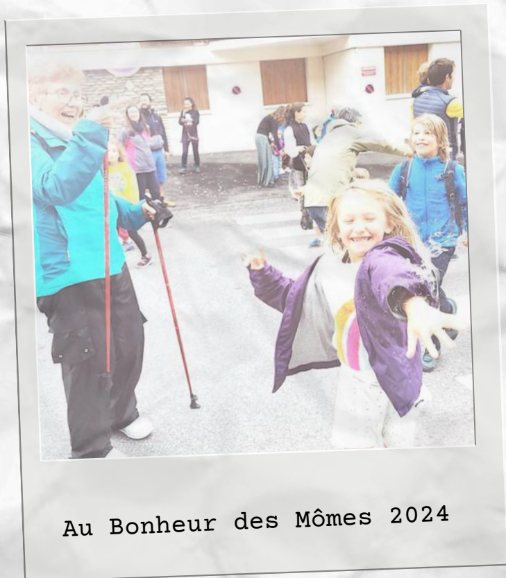
Au Bonheur des Mômes 2024