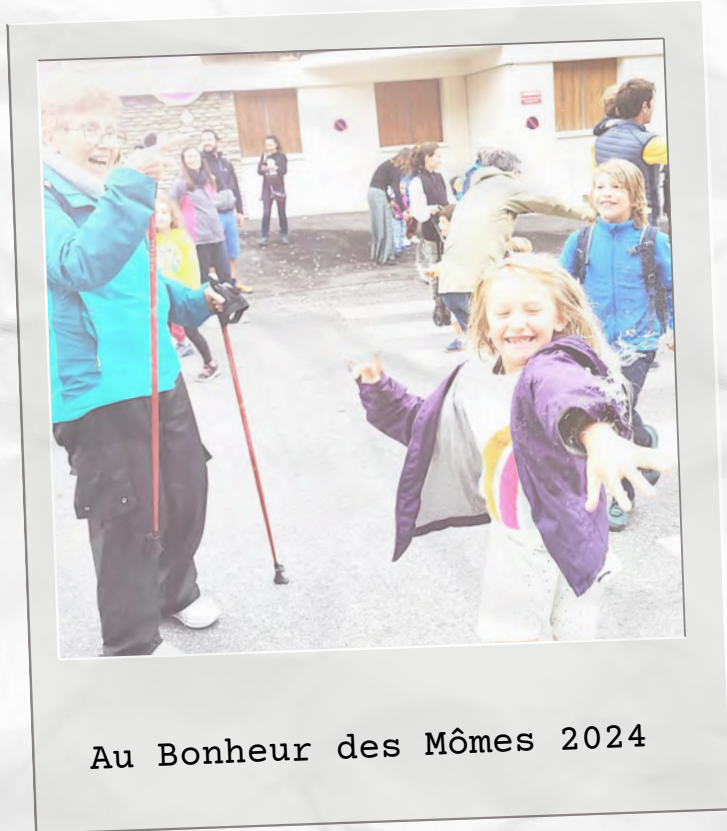
Au Bonheur des Mômes 2024